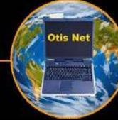
Otis Net global network